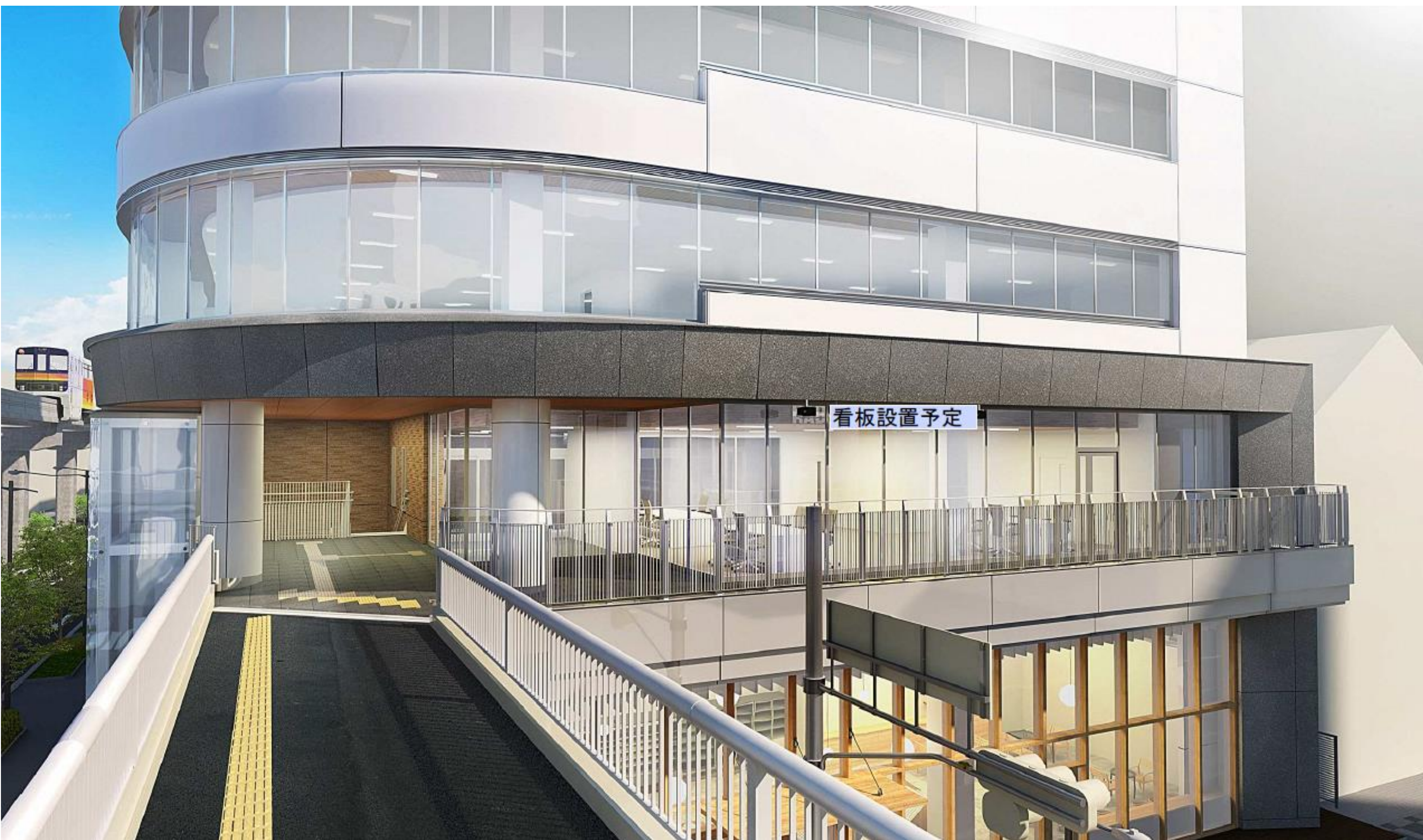
外観イメージ(北側デッキ)