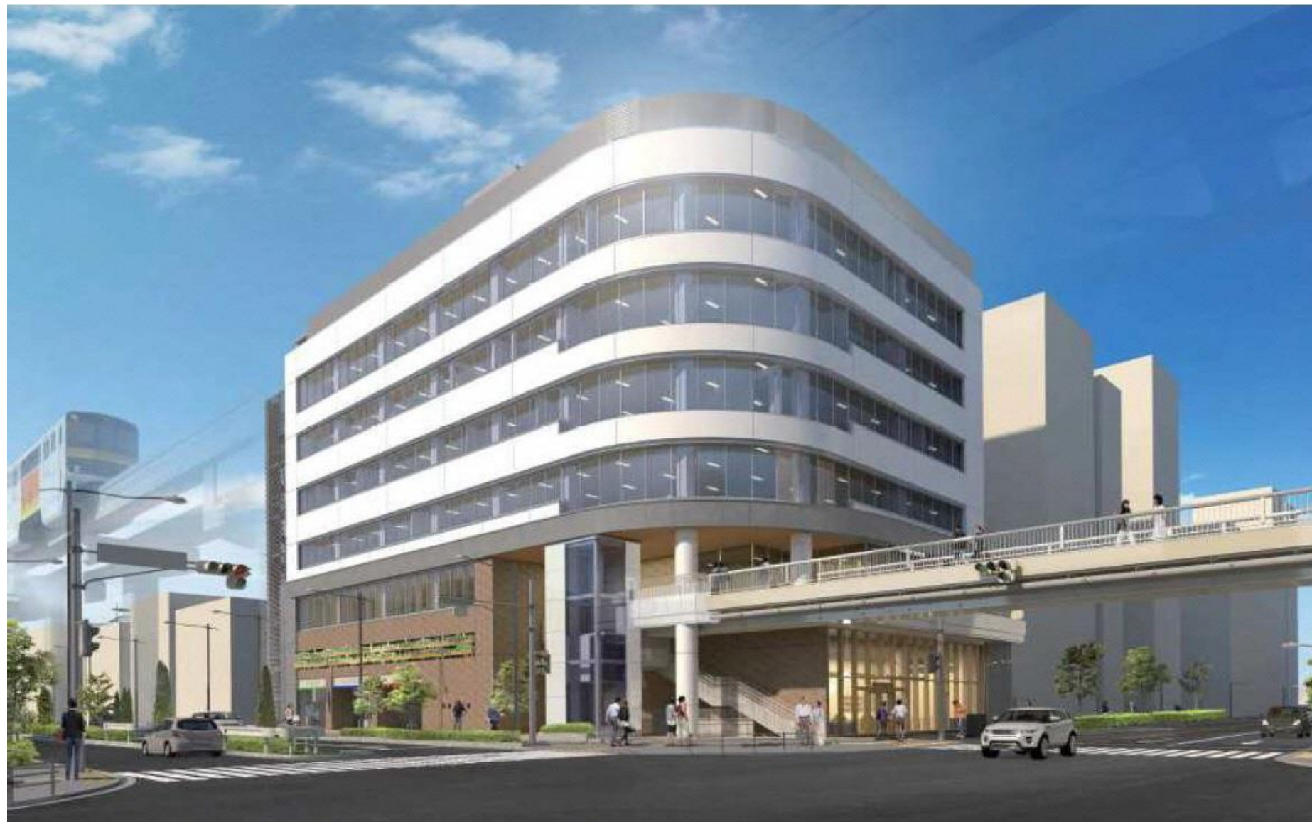
外観イメージ(北東側)