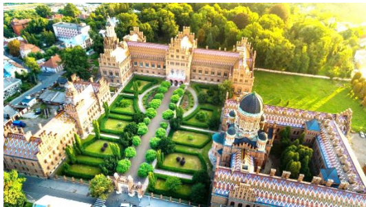
ウクライナの世界遺産