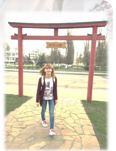
キーウ(京都市の姉妹都市)にある京都公園