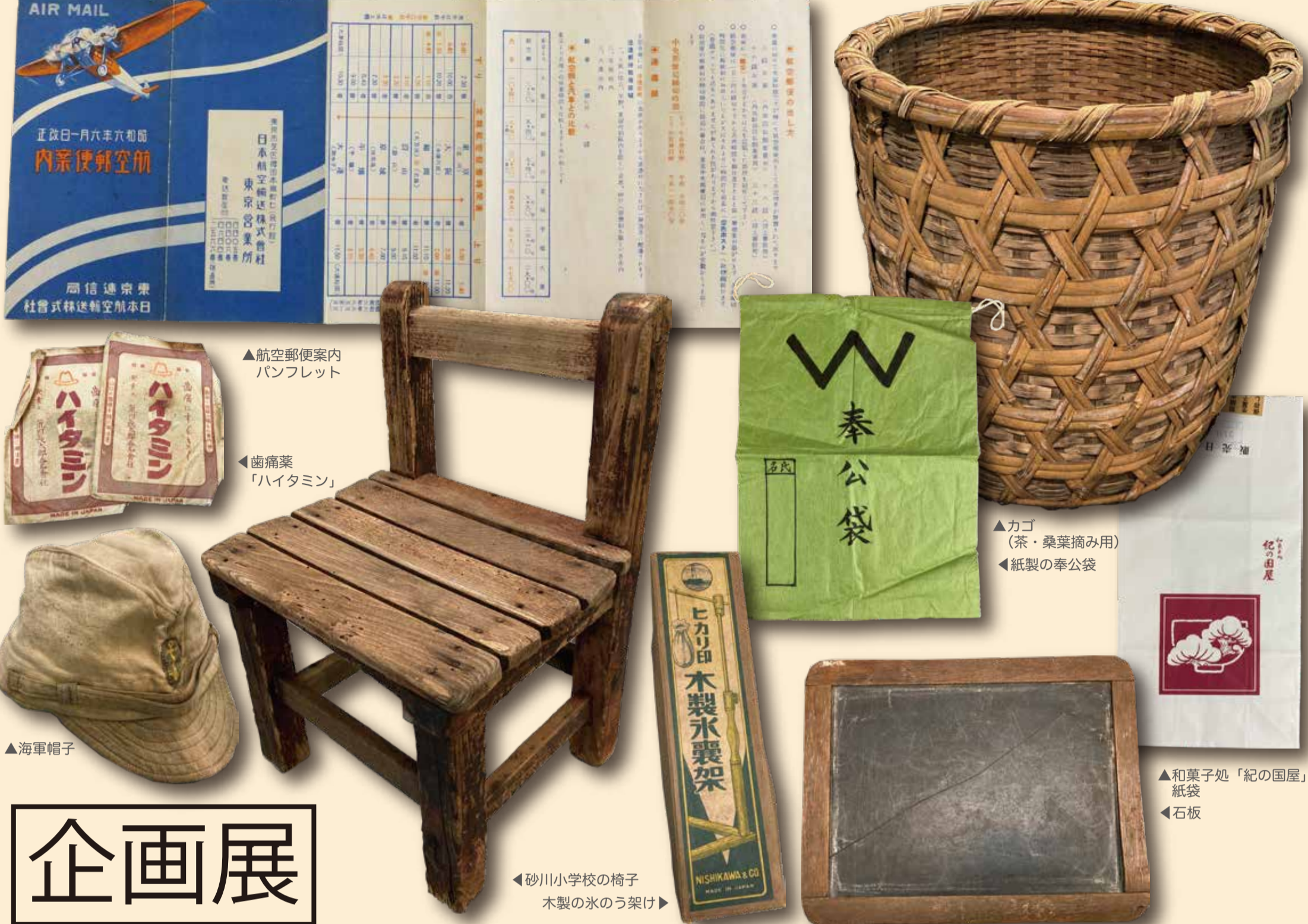
▲航空郵便案内パンフレット