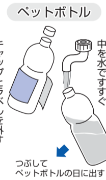
キャップとラベルを外す

北地区=緑町・栄町・若葉町・幸町・柏町・泉町・砂川町・上砂町・一番町・西砂町 南地区=富士見町・柴崎町・錦町・羽衣町・曙町・高松町