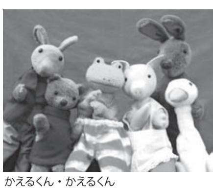
かえるくん・かえるくん

子育てで人形劇との関わりなどのお話を聞き、人形劇を観劇します。2部構成。どちらか片方だけの参加もできます。