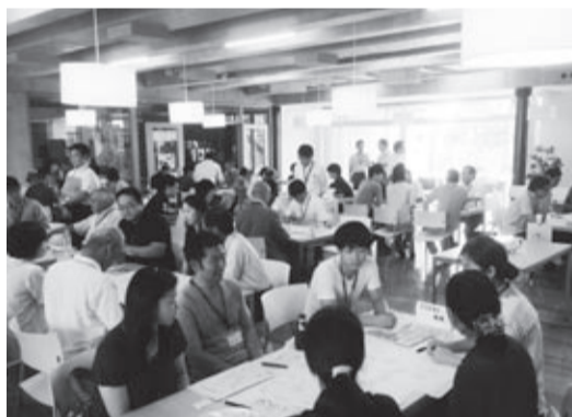
自由な雰囲気で見聞を交わっています

ちかわまたは、市ホームページをご覧ください。 問 企画政策課・内線2688 Fax (521) 2953 kikakusei@city.tachikawa.lg.jp