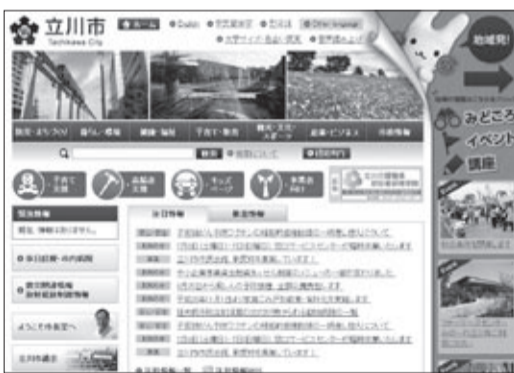
リニューアル後のトップページのイメージ

ページ以外のページアドレスは変わりますので、お気に入りやブックマークなどに登録している方はご注意ください。