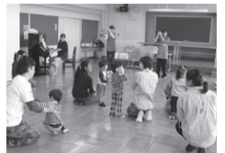
親子で楽しめる講座も企画できます

①ゼロから始めるパソコン講座 対初心者 時6月17日(火)～20日(金)、午前10時～正午(全4回) 費500円程度