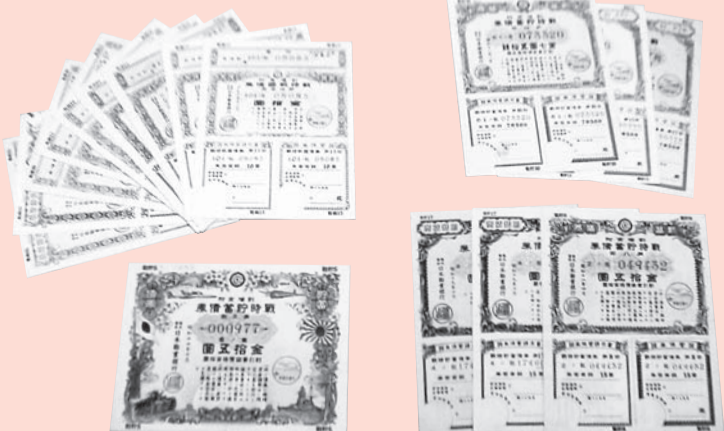
(参考)保管証券類の例