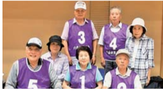
3位入賞の「六番組長寿会」

立川市の老人クラブではさまざまなスポーツやレクリエーションが活発に行われています。60歳以上の市民の方は高齢期の健康づくり、仲間づくりのため老人クラブに参加しませんか。