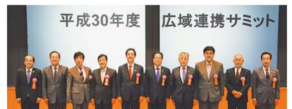
平成30年度 広域連携サミット

今回は、「人口減少社会における広域連携のあり方~住みたい、訪れたい、活力あるまちづくりを目指して」をテーマに、人口減少への対応策等について意見交換を行いました。当日は、多くの傍聴者が参加する中、広域連携による今後の展望等についてさまざまな発言がありました。