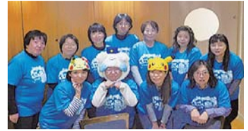
立川キャラバン隊の皆さん

市は、障害のある人もない人も住み慣れた地域で共に生きることでできる社会を実現するため、障害のある方への理解を促進する啓発活動などを行っています。●申の催しは申込制(申込順)。そのほかの催しは直接会場へ。