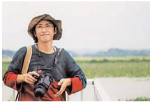
写真家・齋藤陽道さん

●写真家・齋藤陽道さんによる撮影会 聴覚に障害があり、ミュージシャンや俳優との作品で注目を集める齋藤陽道さんがインスタントカメラで写真を撮ります。写真はその場で差しあげます。 時12月8日(土)午前11時~正午 午後4時~5時 場市役所1階多目的プラザ 申福祉ホットライン ☎(526)1418 Fax(523)5545へ