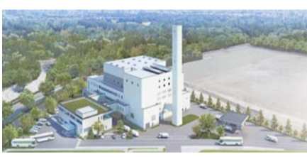
新清掃工場イメージ図

新清掃工場の設計、建設、運営に関する事業について、荏原環境プラント株式会社、吉川建設株式会社、株式会社社、株式会社社たちがEサービスと令和元年6月27日に基本契約を締結しました。