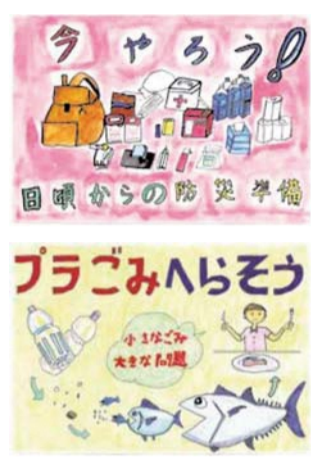
昨年度の優秀作品

令和2年2月に開催する「第18回くらしフェスタ立川」で展示するポスターを募集します。優秀作品はポスターやチラシとして採用します。応募者全員に参加賞あり▶テーマ=ごみ、水、大気、自然保護などの環境や日々のくらしに関すること(絵の中には言葉も入れてください。まんが等のキャラクターは使用しないでください)▶用紙=四切りの画用紙▶申込方法=9月13日(金)(必着)までに、作品の裏面に住所、氏名(ふりがな)、電話番号、年齢(小・中学生は学校名と学年も)を書いて、直接、または郵送で、生活安全課消費生活センター係(〒190-0012