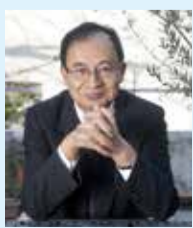
北川フラムさん

●ファーレ立川アート塾 vol.4 ゲストは、ファーレ立川のアートプランナーで、平成30年度の文化功労者に選ばれた北川フラムさん(時)10月13日(日)午前11時30分~午後1時(場)コトブキヤホール(緑町4-5コトブキヤビル3階)定30人(申込順)費2,500円(軽食付き)申10月7日(月)(必着)までに、「ファーレ立川アート」のホームページをご覧ください。