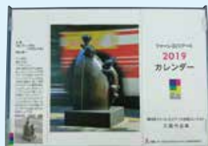
(写真は昨年のカレンダー)

●オリジナルカレンダープレゼント 10月12日(土)と13日(日)の午前11時から各日先着100人に「第5回ファーレ立川アート写真コンテスト」入賞作品(11面参照)を使用して作成した2020年のオリジナルカレンダーをプレゼントします。本部ブース(立川高島屋S.C.北側。雨天時は女性総合センター1階)で配布します。