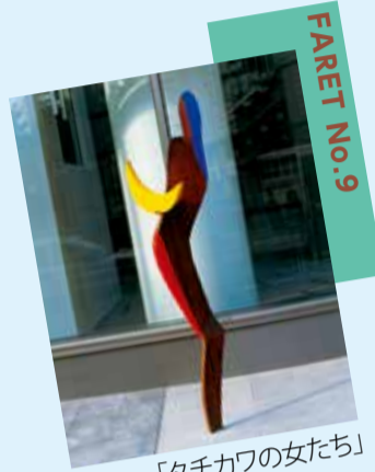
「たちかわの女たち」