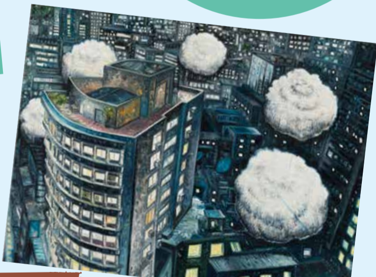
Light Flower (Centro)