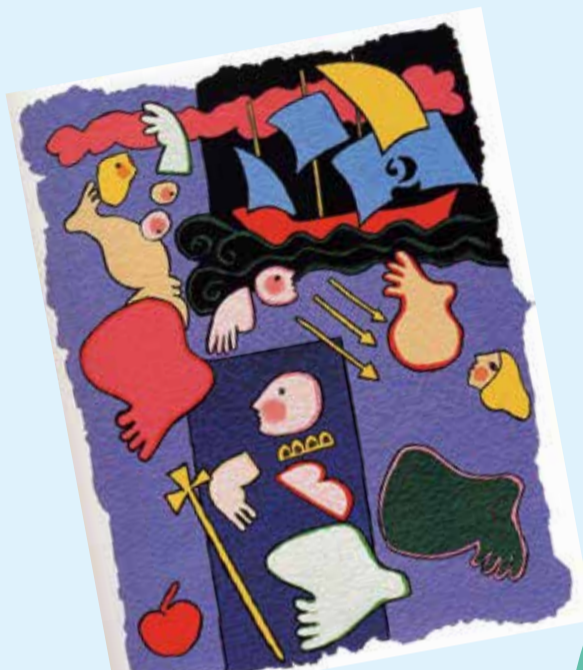
ジョゼ・デ・ギマランイス

●展示「ファーレ立川アートのこれまでと、これから」 ファーレ立川アートに参加している作家の現在の仕事と作品のほか、立川につながりがある現代作家の作品や「ファーレ立川アート」を題材にした武蔵野美術大学学生の作品などを紹介(時)10月8日(火)~14日(月・祝)場女性総合センター1階ギャラリーほか4か所のビルのエントランスなどに展示