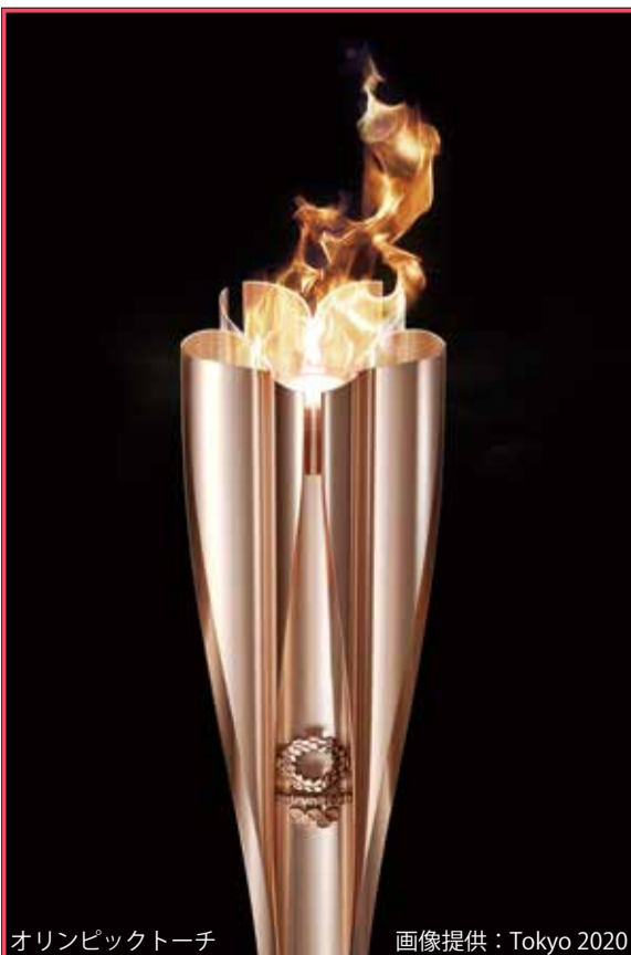
オリンピックトーチ