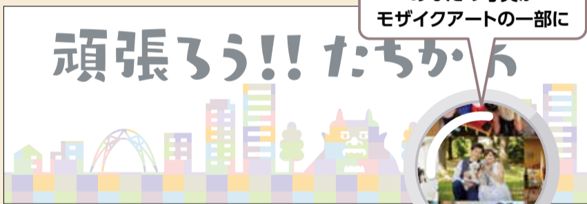
イメージ画像です。完成品とは異なります。

モザイクアートとは、たくさんの写真を組み合わせて一つの絵や写真などを表現する作品です。皆さんの笑顔でオンリーワンのモザイクアートを作りましょう。