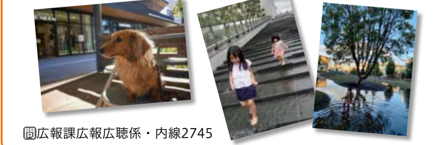
☎広報課広報広聴係・内線2745