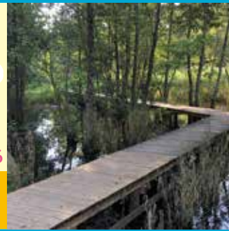
「矢川緑地湧き水の池」 ペンネーム BUNさん

家の近くにある矢川緑地です。湧き水から作った池は、春はおたまじやくしがいて、秋はトンボが飛び回るやすらぎの場所です。