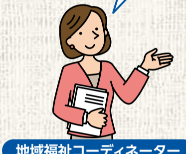
地域福祉コーディネーター