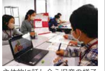
主体的に話し合う児童の様子