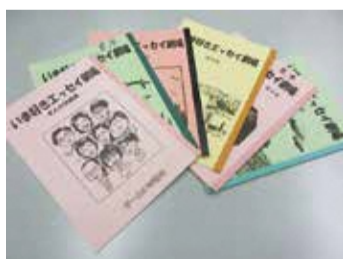
活動を通じて作成したエッセイ集