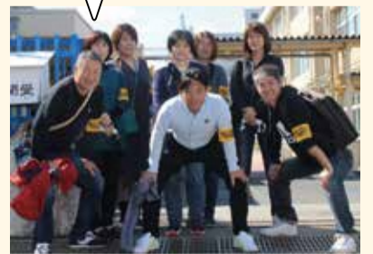
砂川地区あいあいパトロール隊の皆さん

子どもの送り迎えや犬の散歩など、普段の生活でできる範囲でパトロールしています。隊員の結束力と自主性が強みです。