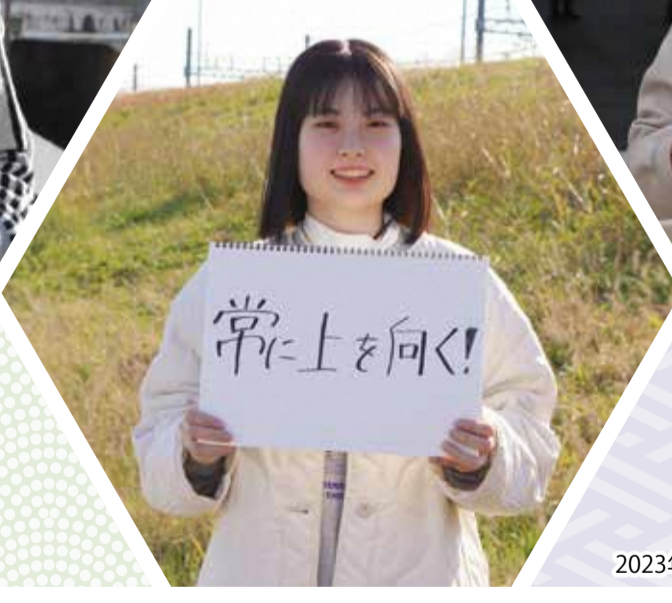
2023年二十歳を祝うつどい実行委員会の皆さん