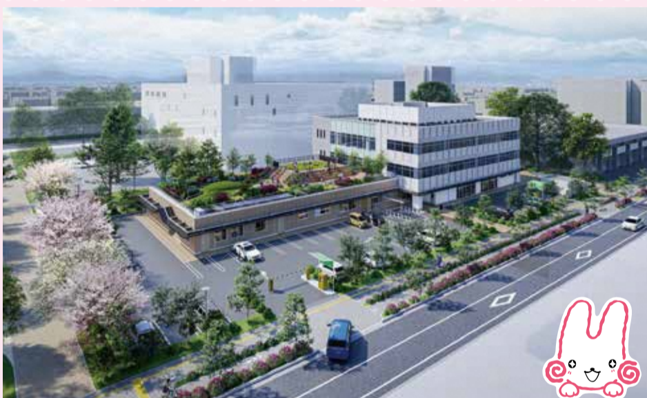
完成イメージ(実際と異なることがあります)