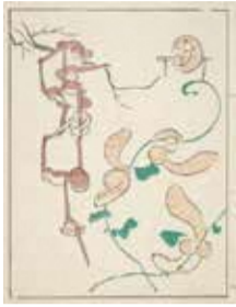
鯉形憲斎「鳥獣略画式」個人蔵