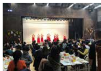
イヤーエンドパーティー (令和元年12月)

SDGsコラム vol.10 地域の橋渡し ~立川国際友好協会の取り組み Q 取り組みの概要を教えてください。 A 柴崎学習館と西砂学習館で、木曜日の午前と土曜日の夜に、日本語教室を開催しています。教室では、日本の文化を伝えるために季節の行事を行ったり、学習の成果を発表するスピーチ会を行ったりして交流もしています。 Q SDGsに取り組む際に意識している点は何ですか。 A 日本の言葉や文化を伝えるだけでなく、相手の文化や習慣などを尊重することを大切にしながら取り組んでいます。