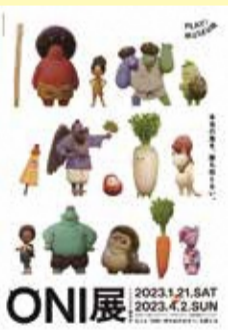
「ONI展」メインビジュアル