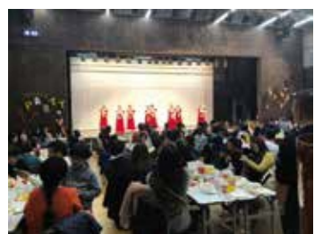
イヤーエンドパーティー (令和元年12月)