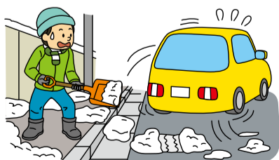
園道路課維持係・内線2401

●雪を排水溝の上部に捨てないでください。排水溝が雪でふさがっていると、解けた水が流れず路面凍結につながります。