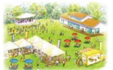
公共公益・地域活性化ゾーンイメージ図