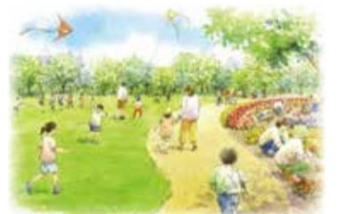
緑・やすらぎゾーンイメージ図