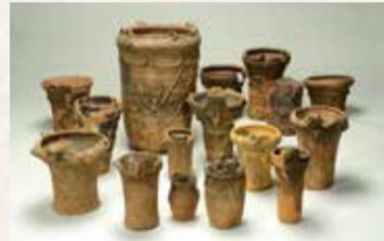
向郷遺跡第25地点から出土した土器群

立川市域の遺跡から出土した先史時代(旧石器時代・縄文時代・弥生時代・古墳時代)の主要な考古資料をまとめました。遺構・遺物だけでなく、種実圧痕の自然科学的分析の成果や、地中レーダー探査による古墳の調査成果、都市開発の中で進められてきた遺跡の保護と埋蔵文化財調査の歩みなどを収録しています。