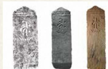
文永12(1275)年銘板碑 普濟寺所蔵

立川市に遺された古代・中世の遺跡、石造物、仏像等の美術工芸品についてまとめました。損傷・損失してしまったものについても、調査・再検証を行いました。普濟寺六面石幢、柴崎町の旧満願寺に安置されていた仏像など、身近にある貴重な文化財を知ることができます。