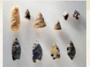
向郷遺跡第21地点から出土した旧石器資料