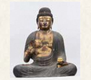
旧満願寺薬師如来坐像 小平市円成院所蔵