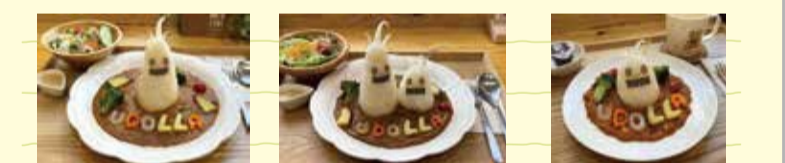
ウドライスカレー 1,430円 ウドライスカレー(大盛り) 1,730円 コウライスカレー(キッズ用) 990円

「ウドライスカレー」をはじめとして、「ウドらあんみつ」「ウドラシェイク」など、魅力的なメニューをお楽しみいただけます。 (価格はすべて税込)