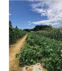
特別賞 「体験農園の夏野菜畑」 shinji.nakamura.370さん