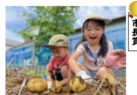
市長賞 「大きなジャガイモ見つけられるかな」 1hime2taro_mamaさん