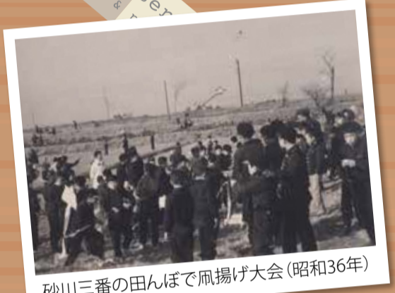
砂川三番の田んぼで凧揚げ大会(昭和36年)