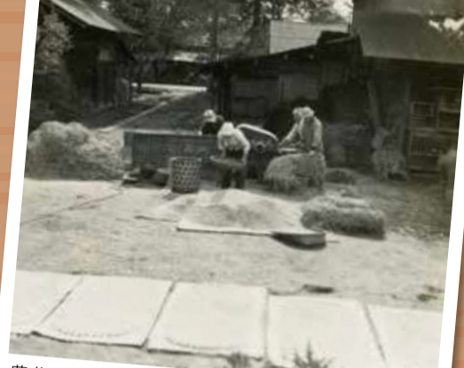
農作業の様子(昭和29年ごろ)