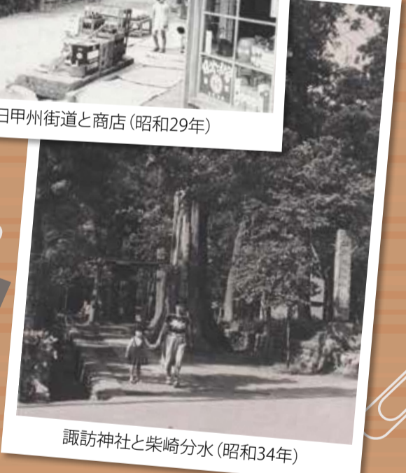
諏訪神社と柴崎分水(昭和34年)