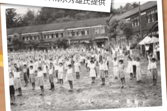
第一小学校でラジオ体操(昭和28年)