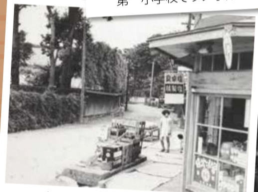
旧甲州街道と商店(昭和29年)