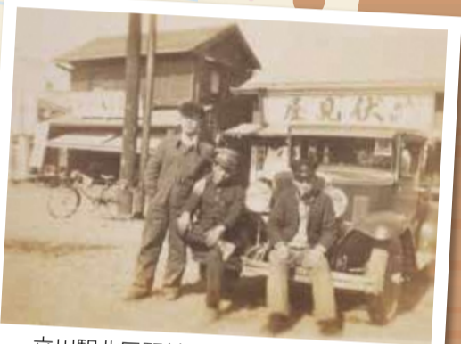
立川駅北口駅前のタクシー(昭和初期)