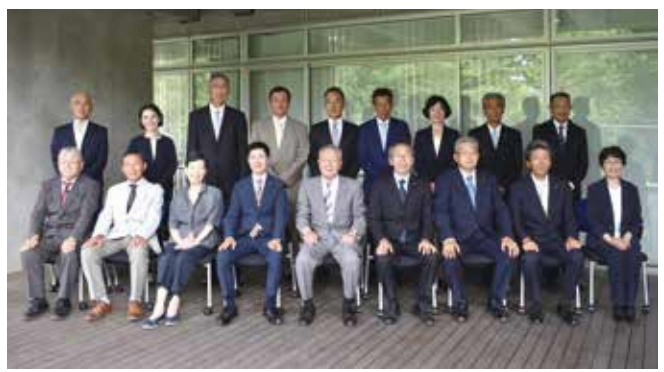
新しい農業委員と農地利用最適化推進委員の皆さん