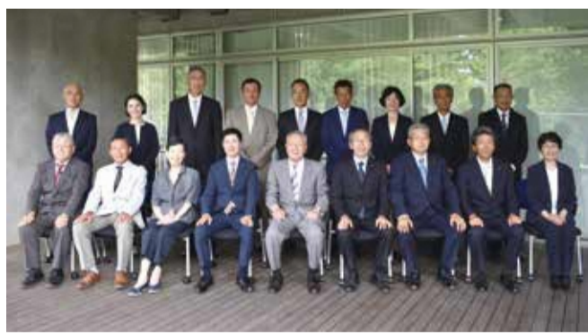
新しい農業委員と農地利用最適化推進委員の皆さん