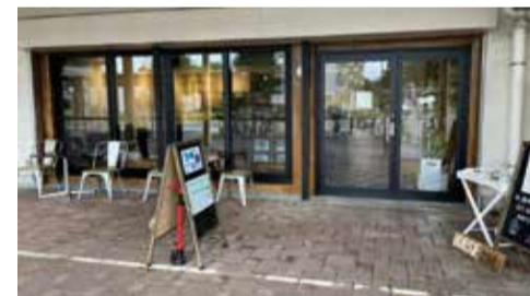
人と情報が集まるBASE(基地)、元が精肉店だったので298(ニクヤ)の「BASE☆298」(若葉町)