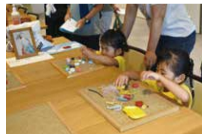
廃材のプラスチックで思い思いにアートを作りました