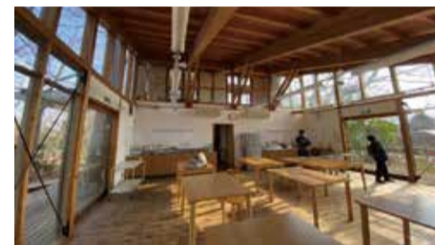
「食と人との交流」をテーマに4月から週3回開かれている「スマイルキッチン」(幸町)

誰もが気軽にふらっと立ち寄れる居場所です。地域の空きスペースを活用して、住民主体で運営しています。令和5年4月時点で市内に12か所設置され、子どもの遊び場や、健康相談、各種ワークショップのほか、テーマに沿った茶話会など、それぞれの特色を生かした活動が行われています。市と住民、関係機関が協働して、子どもから高齢者までのさまざまな困りごとの解決を目指します。