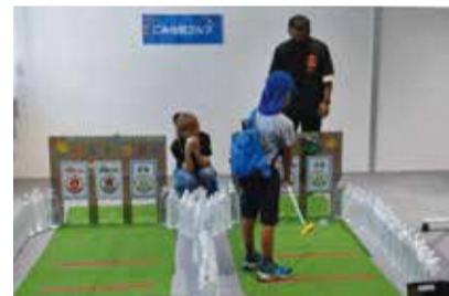
ゴルフで遊びながらごみの分別について学びました

たちむにいには、ごみを処理するだけでなく、環境学習を行える機能を備えていることが特徴です。7月30日には、運営開始後初となるイベント「たちむにいフェス」を開催し、廃材ワークショップや環境ゲーム、施設探検ラリー等を行いました。