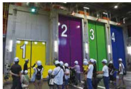
施設探検ラリーではプラットホームも見学しました