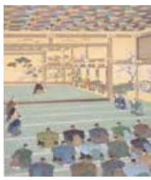
邨田丹陵《聖徳記念絵画館壁画下図「大政奉還」》明治神宮所蔵 前期展示(聖徳記念絵画館の壁画の展示ではありません)

北多摩郡砂川村(現在の砂川町)で半生を過ごした絵師・邨田丹陵に焦点を当てた、初の本格的な長期間の展覧会。やまと絵の伝統を継承しつつ進化を極めた丹陵の作品の数々に出会えます。直接会場へ 時▷前期=2月18日(日)まで▷後期=2月24日(土)~3月31日(日)、午前10時~午後6時(月曜日休館。2月12日(月・休)は開館、翌13日(火)が休館。入場は午後5時30分まで) 場たましん美術館(緑町3-4) 費500円(高校・大学生300円、中学生以下無料) 場立川市地域文化振興財団 ☎(526)1312