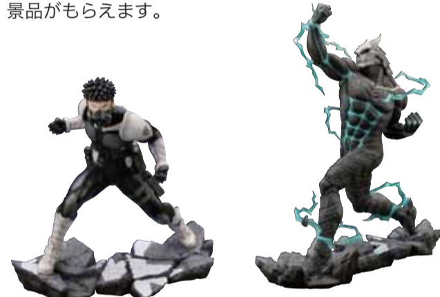
ARTFXJ「怪獣8号&ARTFXJ」日比野カフカ 2体セット／(株式会社壽屋提供)など 豪華賞品を用意！

イベント期間中、市内の施設に怪獣パネルが設置されます。怪獣を探してXに投稿した方は、抽選で豪華景品がもらえます。