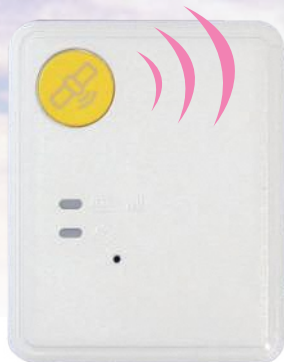
原寸大(縦47.5mm 横38.5mm 厚さ11.85mm)

徘徊の兆候が見受けられる在宅の認知症高齢者等を介護しているご家族に対して、徘徊してしまった際に早期に発見するための、位置情報を検索できる端末の貸し出しと毎月の利用料を助成します。また、日常生活賠償保険を付帯し、万一の事故に備えます。 (委託先:ホームネット株式会社)