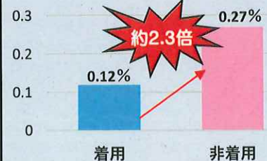
ヘルメット着用状況別の致死率 (令和元年~3年)