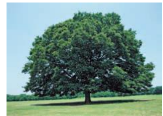
しき 市の木 けやき