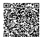
防災、水害・土砂災害ハザードマップ