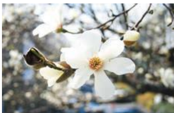
しはな 市の花 こぶし