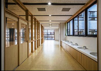
新下・子洗いコーナー