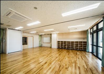
特別活動センター