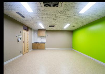
PTA・学校支援センター