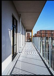
東側バルコニー(図書)