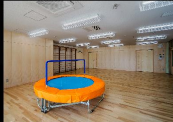
プレイルーム(特別支援学級)2