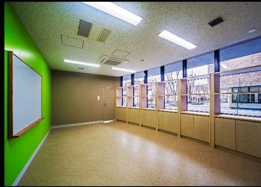
コミュニティールーム