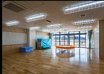
プレイルーム(特別支援学級)1