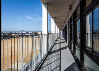
南側バルコニー(図書)