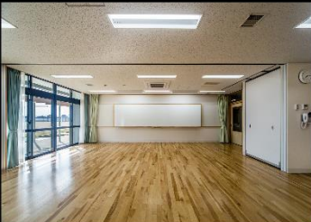
特別活動センター