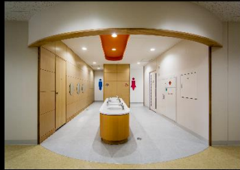
廊下・エレベーター