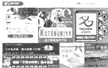
「たちかわ電子図書館」トップ画面

立川市中央図書館が表彰される主な理由として、「たちかわ電子図書館」事業が読書に親しむ児童・生徒の育成に努め、読書を身近なものとして習慣づけることに力を入れており、民間事業者等からの支援を活用しながら読書活動の定着化に取り組んでいることが評価されたものです。