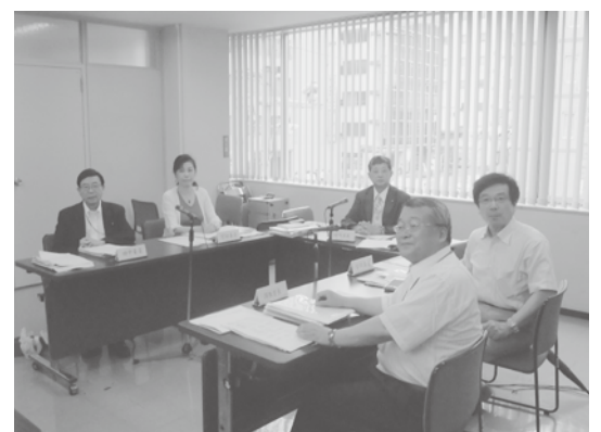
教育委員会(定例会)