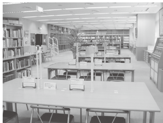
中央図書館レファレンス室

利用者からの様々な質問に、図書館の資料や機能を活用して、資料提供や回答をしていくのがレファレンスサービスです。各館では、各種辞典や年鑑、図鑑、地図などの参考資料を備えて様々なレファレンスに応じているほか、中央図書館では、参考資料を揃えたレファレンス室を設けるとともに、立川関連の新聞・雑誌記事見出しのCD-ROMを作成し、検索の便利を図ったり、インターネットを利用したりして、幅広い情報の提供に努めています。