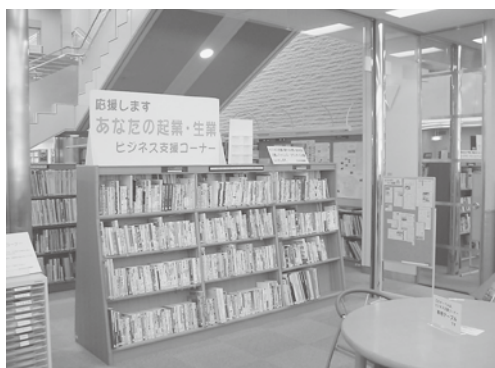
中央図書館ビジネス支援ライブラリー

イ 休館日 月曜日（国民の祝日が月曜日と重なった場合は開館し、その翌日の火曜日）、第3木曜日、年末・年始、特別整理期間