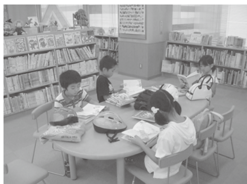
中央図書館児童書コーナー