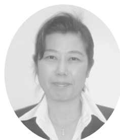
宮田委員(委員長職務代理者)