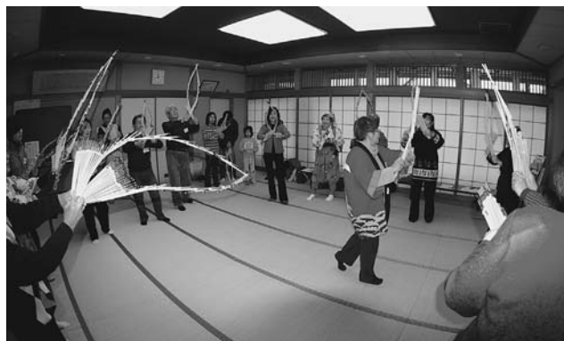
第3回たちかわ市民講師フェア「南京玉すだれに挑戦！」

生涯学習時代に合った市民の学習活動を奨励するため、社会教育関係団体の登録制度を設け、学習の場を提供しているほか、各種団体の指導者を中心とした研修事業や団体への事業委託を行い、団体の自主性と指導性の充実・強化に努めています。