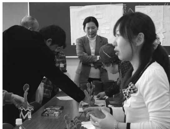
新しい学習館の芽を大輪の花に！ ～楽しい高松学習館にしたい！

地域の活性化をねらいに、地域学習館運営協議会準備会の意見も活かした講座等を開催しました。