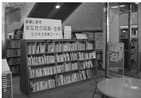
中央図書館ビジネス支援ライブラリー

◆幸・錦図書館 第2・第4月曜日（国民の祝日が月曜日と重なった場合は開館し、その翌日の火曜日）、年末・年始、特別整理期間、法定電気設備点検日