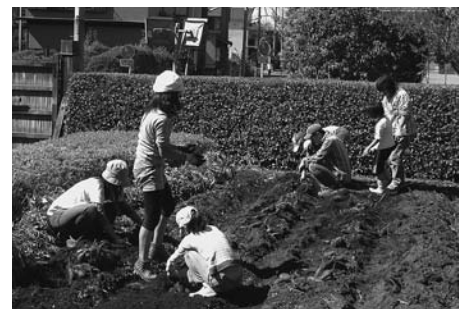
通年体験学習「さつまいもの収穫」