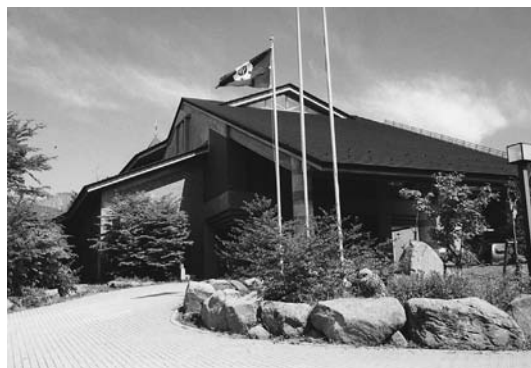
山梨県清里高原にある立川市八ヶ岳山荘

山梨県の清里高原に校外教育の場として、立川市八ヶ岳山荘を開設しています。八ヶ岳山荘は、平成3年に完成した本館（通年利用可）や大体育館などのほか、小体育館、炊事棟などからなり、小学校の自然教室や中学校の移動教室、青少年団体の自然の家等で利用されているほか、学校や団体が利用しない期間は、市民保養施設として一般の方へ開放しています。