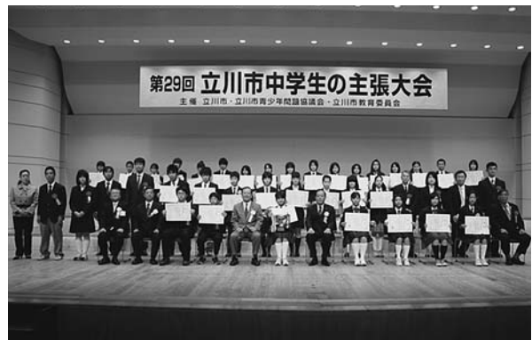
中学生の主張大会

この「青少年健全育成市民行動方針」は、青少年を取り巻く環境の変化に対応した市民運動を推進するため、市が青少年問題協議会に諮問し、同協議会からの答申をもとに様々な角度から検討を行い、平成21年度に策定し、平成22年度から新たに実践しています。この市民行動方針は、3つの柱を定め、家庭・大人・学校・地域が連携して、市民一体となって市民運動を進めることとしています。また、青少年の健全育成を進めるなかでは、乳幼児期の取り組みの大切さから、1つ目の柱の中にこの時期の取り組みを取り上げています。