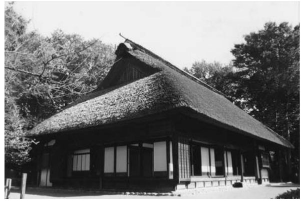
川越道緑地古民家園

川越道緑地古民家園は、貴重な文化財を保護し、伝統的な生活文化を伝承するため、江戸時代末期に建築された民家を移築・復元したもので、平成5年10月に開園しました。園内には、茅葺き・入母屋造りの母家のほか、穀倉などがあります。庭も昔の農家の庭を再現しており、訪れた市民が立川の伝統文化に触れることができます。母家では、昔の農機具や生活道具などが展示されているほか、3月には桃の節句展、5月には端午の節句展を開催しています。また、園内の畑では1年間を通じて農作業を行い、年中行事等とあわせて農家の生活を実体験できる「通年体験学習」も開催しており、多くの方に参加いただいています。