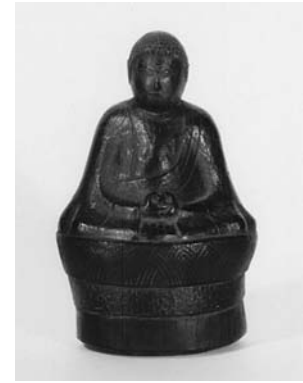
八幡神社本地仏像