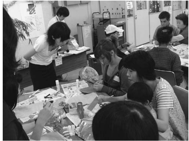
多文化共生・国際理解講座「留学生と七夕飾りを作ろう」

生涯学習時代を迎え、市民の学習意欲は年々高まっており、その学習要望もますます増大し、多様化してきています。こうした中、立川市では市内の6館の公民館を平成19年10月1日から市民交流大学構想に基づいて地域学習館に転用し、平成21年3月に地域学習館運営協議会準備会を、平成22年6月に地域学習館運営協議会を設置し、地域住民のニーズを汲み上げながら様々な講座や催しを行っています。また、環境・平和・子ども等の市域