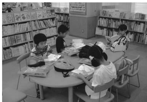
中央図書館児童書コーナー