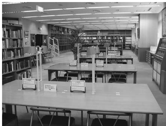
中央図書館レファレンス室

利用者からの様々な質問に、図書館の資料や機能を活用して、資料提供や回答をしていくのがレファレンスサービスです。各館では、各種辞典や年鑑、図鑑、地図などの参考資料を備えて様々なレファレンスに応じているほか、中央図書館では、参考資料を揃えたレファレンス室を設けるとともに、立川関連の新聞・雑誌記事見出しのCD-ROMを作成し、検索の便利を図ったり、インターネットを利用したりして、幅広い情報の提供に努めています。