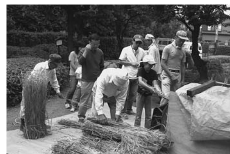
通年体験学習「麦の脱穀」