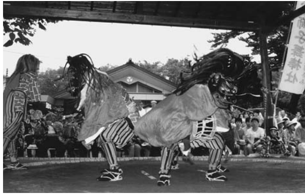
市指定無形民俗文化財「獅子舞」