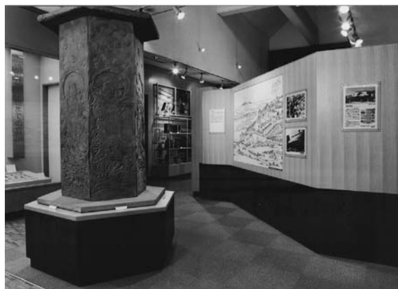
常設展示室（中世の立川）

歴史民俗資料館は、貴重な文化財を収集・保管・展示するとともに、調査・研究も行う施設で、昭和60年12月に開館しました。同館1階の展示室では化石や石器、土器、古文書、民具、伝統技術、芸能の記録といった様々な資料をテーマごとに展示しています。また、2階の収蔵庫には発掘で出土した考古資料や寄贈を受けた多数の文化財を保管しています。新館の体験学習室では、ほぼ月に1回の割合で年中行事や食文化を伝える体験学習事業を開催しています。