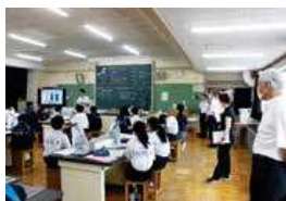
二中への学校訪問の様子