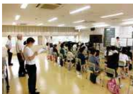
南砂小への学校訪問の様子