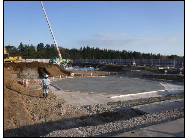
地盤改良工事(完了)