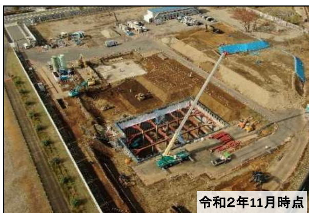
全景写真(敷地南東より)