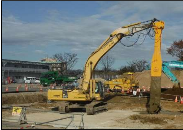
地盤改良工事(施工中)