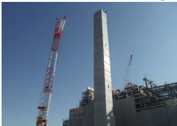
煙突の外筒の施工が完了しました