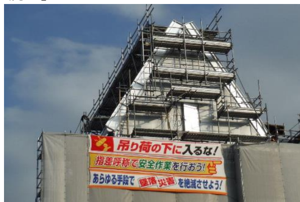
発電に使用した水蒸気を水に戻すための蒸気復水器の据付けを行っています