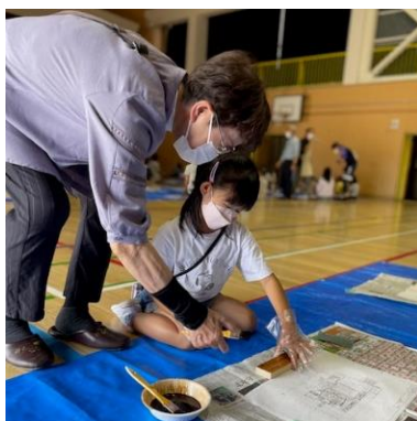
令和4年6月1日 大山小学校 木材塗装ワークショップ