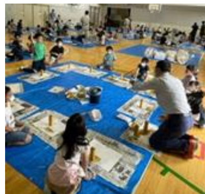
令和4年5月26日 第九小学校 木材塗装ワークショップ