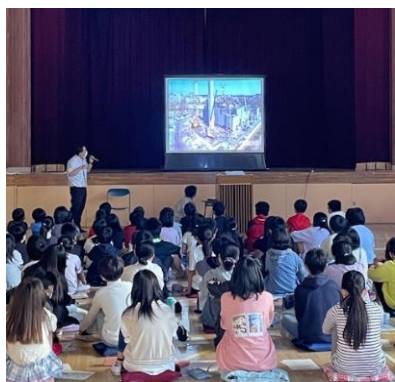
令和4年5月18日 大山小学校授業