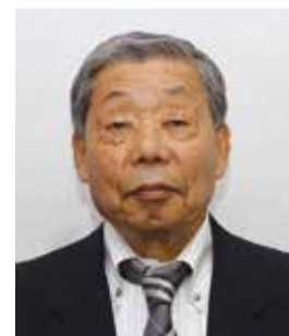
立川市明るい選挙推進協議会

投票所の換気を行います/投票所には手指用消毒液を設置します/鉛筆は使用することに消毒します