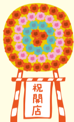
落成式・開店祝いの花輪