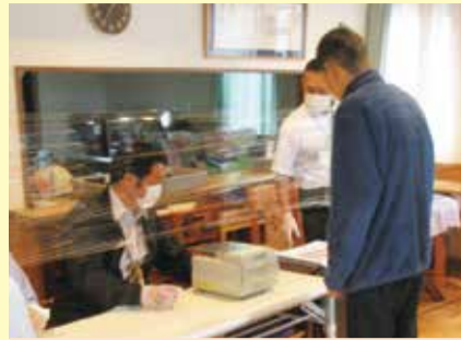
実際の投票器材を使用

昨年5月に、選挙管理委員会と市内施設が連携して選挙の体験プログラム(模擬投票)を実施しました。選挙に関する出前講座のお申し込みやご相談は、下記事務局へ。