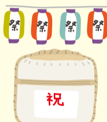
お祭りへの寄附や差し入れ