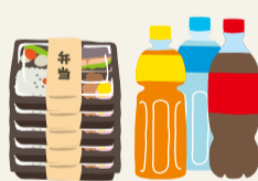
地域の運動会やスポーツ大会への飲食物の差し入れ