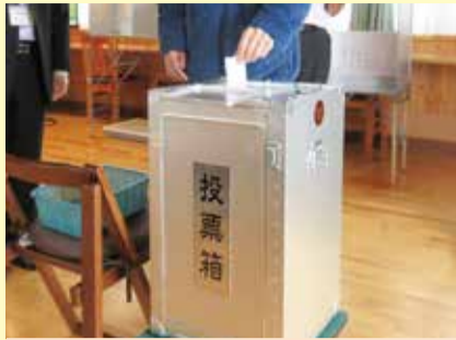
投票体験で雰囲気を実感