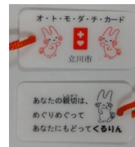
ヘルプカード（表） / ヘルプカード（裏） / オトモダチカード