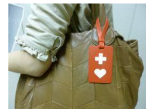
ヘルプマーク（ステッカー） / 使用例