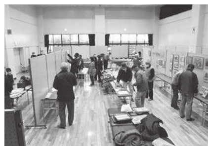
みんなの錦まつり展示会場