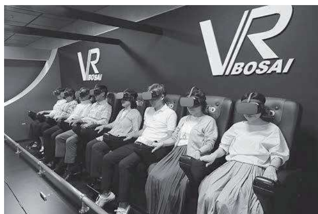
VR防災体験コーナー