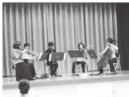
（サークル発表）楽しい音楽会

クリエイトサークル コーラス・サルビア コスモス会 JJ（十文字自彊術）錦会 女性のためのヨガ からだ自立教室