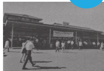
立川駅舎 (昭和45年頃)