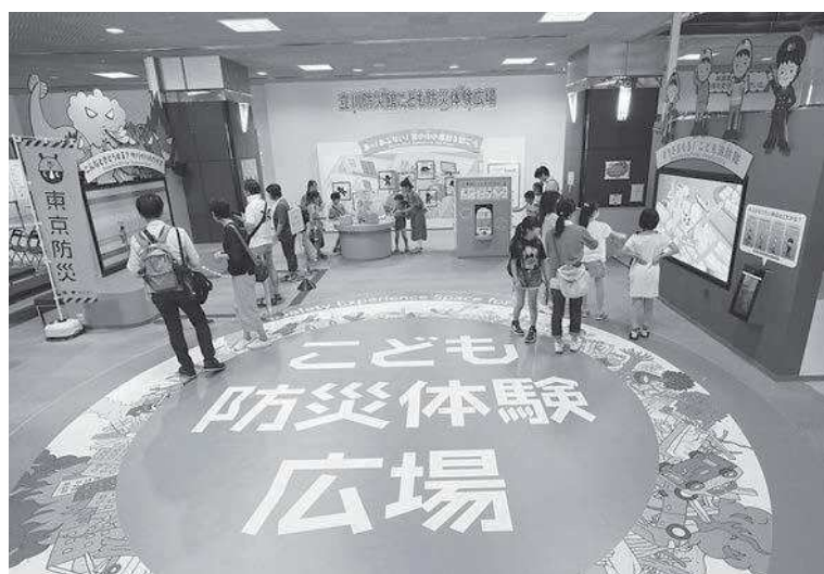
こども防災体験広場

ツアー体験コーナーは、インストラクターが説明をしてくれて、地震体験や煙体験などがありま