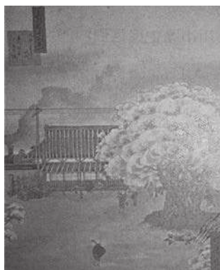
立川駅前千本桜 (明治36年)