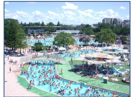
▲レインボープール